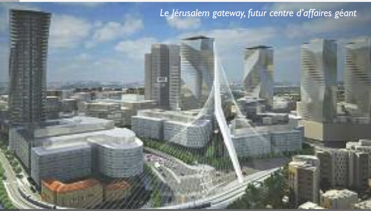
Le Jérusalem gateway, futur centre d'affaires géant

D epuis 70 ans, les découvertes et innovations technologiques de l'État hébreu influencent et irriguent le monde de la recherche et de l'industrie. Avec un PIB de plus de 300 milliards de dollars, Israël est la plus grande économie du Proche-Orient et une puissance internationale. Cette économie de plein emploi est dotée d'une croissance solide. Le dynamisme de l'écosystème d'innovation israélien suscite l'admiration des grandes puissances, de la Chine aux USA, de l'Inde à la Russie. Membre de l'OCDE organisation qui regroupe les 33 pays les plus développés, démocratiques et centrés sur l'économie de marché, la start-up nation a su s'adapter à la mondialisation. Le FMI, la Banque mondiale, l'OCDE, ont salué la performance économique d'Israël et confirment leur confiance dans le développement de ce très jeune État. Parmi les savoir-faire multiples de l'État hébreu, nous présenterons ici les domaines de la cybersécurité, de la voiture autonome, de l'agronomie, de l'aéronautique, de la géothermie, de la médecine, des énergies renouvelables... L'apport de l'État hébreu au savoir et au progrès touche tous les domaines, il est universel. Parmi les technologies décrites dans ce dossier, certaines ont été vendues à des groupes étrangers, des exit, dans le jargon de la high-tech. En 2017, les ventes d'entreprises et de jeunes pousses israéliennes se sont chiffrées à 19 milliards de dollars.