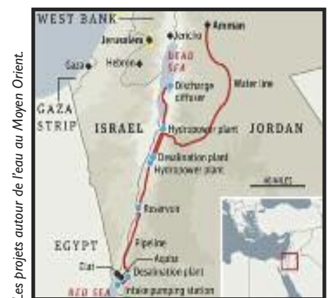
Les projets autour de l'eau au Moyen-Orient.