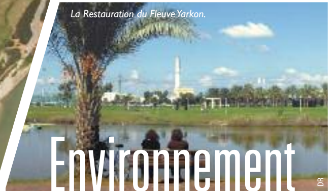
La Restauration du Fleuve Yarkon.

Malgré un environnement géopolitique peu favorable et une sécheresse galopante sur l'ensemble du globe, Israël est le seul pays du monde dans lequel le problème de la pénurie en eaux douces a été résolu définitivement quels que soient les effets du réchauffement climatique et sur la réduction future des précipitations naturelles. On vous raconte comment le génie israélien a assuré son avenir en eau douce.