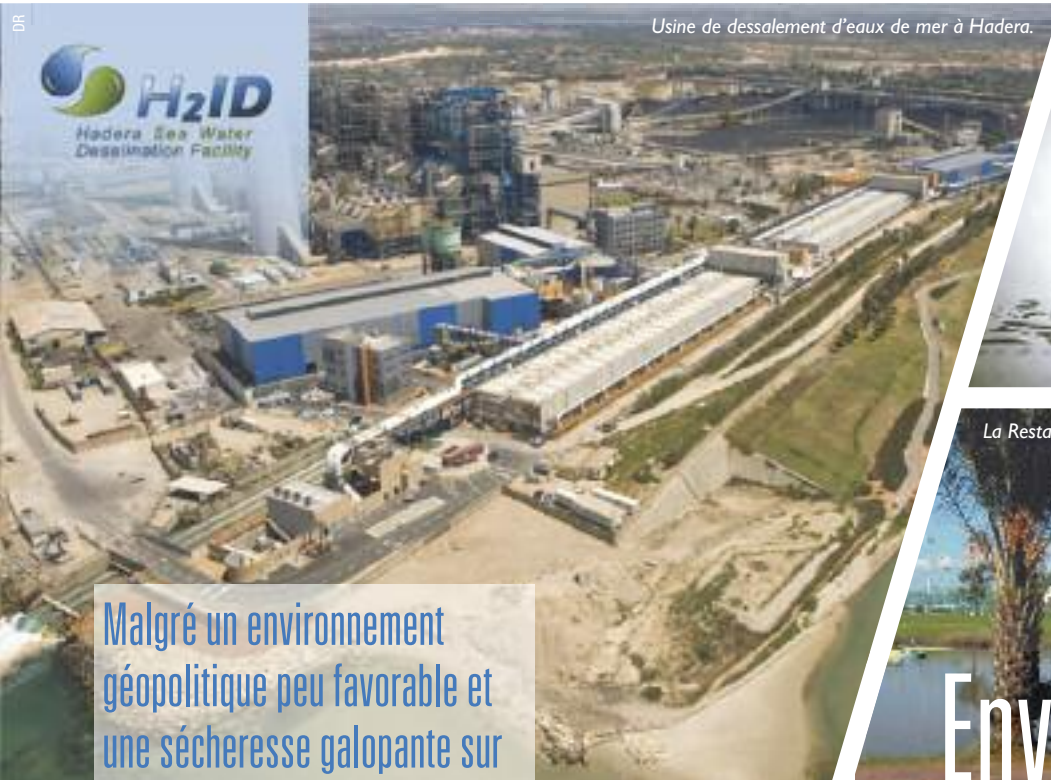
Usine de dessalement d'eaux de mer à Hadera.